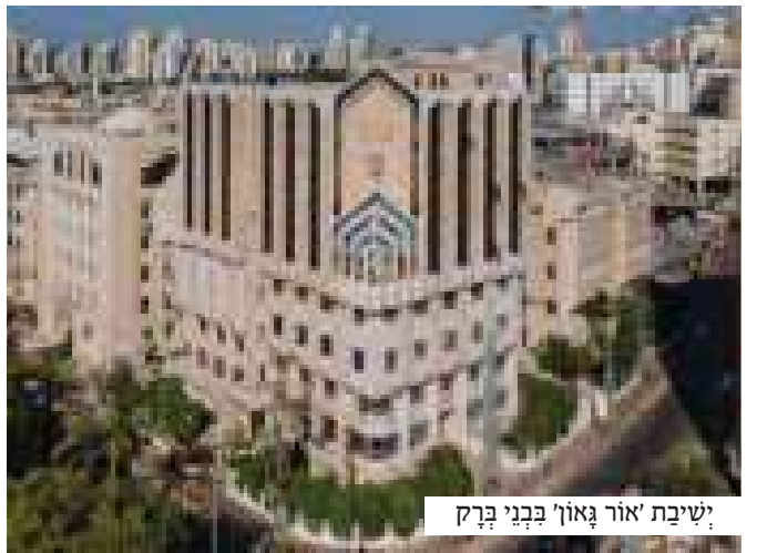
ישיבת 'אור גאון' בבני ברק

"היה זה באחד הערבים שקדמו לחדש אלול האחרון, המשיך האב השכול וספר, "ישבתי והתבוננתי בספוק בשני בני שעסקו יחדו בתורת ה'. באותה שעה צפו ועלו בזכרוני כל אותן שיחות מתוקות שבהן זכיתי לשמע מרבותיהם, מוריהם וחבריהם על תכונותיהם הטובות ועל הצלחתם בלמודים."