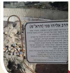
די קבר פון רבי אליהו מני אין די אלטע בית החיים פון די שטאט חברון

דער צדיק רבי אליהו מני איז געבוירן געווארן צו זיין פאטער רבי סולימאן אין יאר תקפ"א אין די שטאט באגדאד.