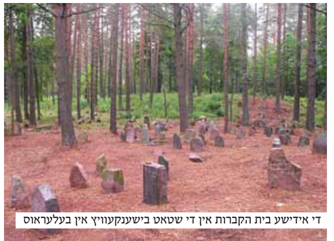
די אידישע בית הקברות אין די שטאט בישענקעוויץ אין בעלעראוס

זייענדיג צובראכן פון די פטירה פון זיין פרוי האט ער זיך אריבערגעכאפט קיין ליאדי און איז אריין צום צדיק אין צימער און זיך אויסגעגאסן פאר אים זיין הארץ. דער רבי האט מיטגעשפירט זיין צער און אים געפרעגט צי ער איז בקי אין ששה סדרי משנה, צי ער קען