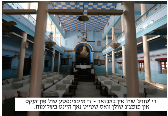
די 'טוויג' שול אין באגדאד - די איינציגסטע שול פון זעקס און פופציג שולן וואס שטייט נאך היינט בשלימות.

קיין איינער האט נישט געוואוסט פון די קבלה וואס ער האט זיך אונטערגענומען. ווי אייביג האט ער עס געהאלטן פאר א סוד, אבער איין שבת נאכמיטאג, ווען זיין זון איז געווען ביי אים און געזען ווי ער זאגט תהלים און ווען ער ענדיגט דערקענט זיך אויף אים א מורא'דיגע שמחה.