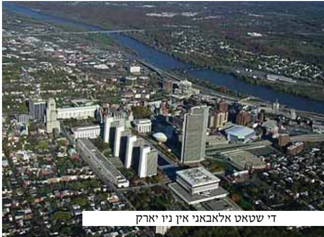
די שטאט אלבאני אין ניו יארק

דער צימער פון דעם דירעקטאר איז געווען פיין אנגעווארעמט, און די ערשטע זאך וואס ר' משה האט דארט געטון איז זיך געווען שטעלן דאווענען מעריב. ווען ער האט געענדיגט דאווענען קומט דער וועכטער צו אים און פרעגט אים צי ער איז א איד.