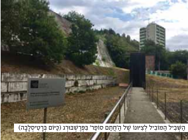
השביל המוביל לצינונו של ה'חתם סופר' בפרשבורג (פיוס ברטיסלבה)