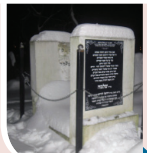
דער ציון הק' פונעם מהרש"ל אינעם אלטן בית הקברות אין לובלין

דער מהרש"ל איז נפטר געווארן י"ב כסלו של"ד זייענדיג פיר און זעכציג יאר, מען האט אים באערדיגט אינעם אלטן בית החיים אין לובלין.