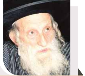
רבי זלמן בריזל