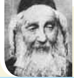
דער נצי"ב פון וואלאזשין

אמן און ברכות אין די זעג פונעם בעל הילולא