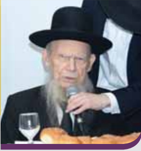
ראש הישיבה הגאון הגדול רבי גרשון אידלשטיין שליט"א