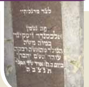
מצבת בעל היסוד ושרש העבודה בהורודנא

רבי אלכסנדר זיסקינד מהורודנא נולד בשנת ה'תצ"ט בראד"נאי, לאביו רבי משה. למד תורה מפי המקבל ר' אריה לייב הלוי אפשטיין בעל ה'פרדס'. שמו נשא בפי כל בחרדת קדש, כמי שכל חייו היו אפופים בקדשה ופרישות למעלה מהשגת אנוש.