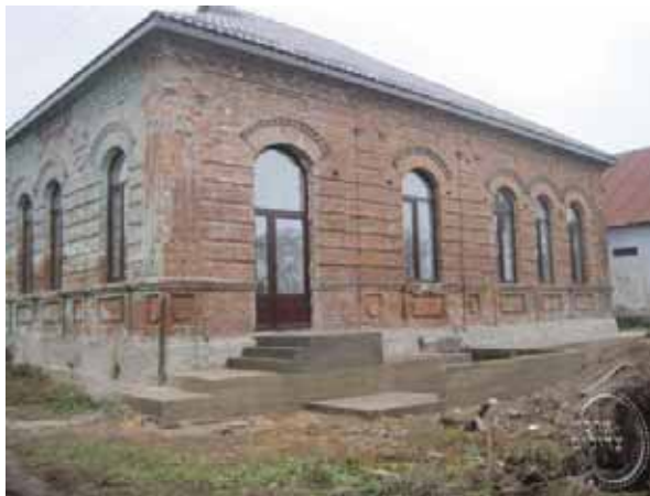
בית מדרשו של בעל האוהב ישראל מאפטא