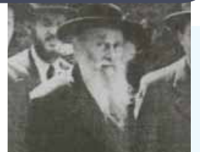
הגר"ש בראך רבה של קאשוי