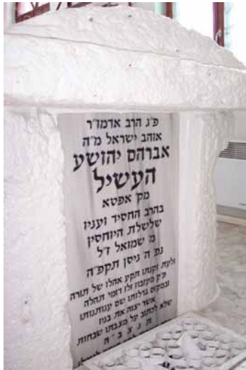
די הייליגע מצבה פונעם 'אוהב ישראל' אין מעיבוש

דער וועג צוריק איז געווען שווער און פול מיט סכנה'ס, און דער סוחר האט געבלאנדזעשט און נישט געקענט געפינען אן אויסוועג. דאס עסן איז אים אסגעגאנגען, און ער איז ארומגעגאנגען באזארגט פון די טויט