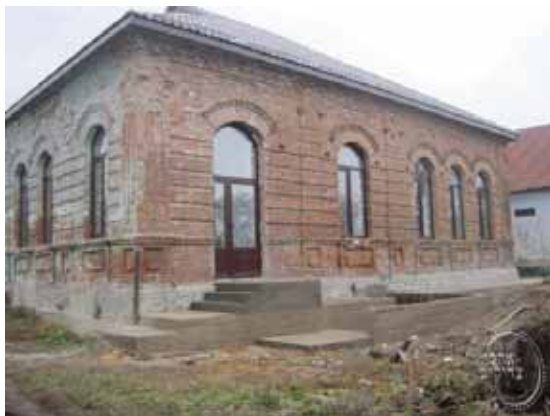
דער בית המדרש פונעם 'אוהב ישראל' פון אפטא