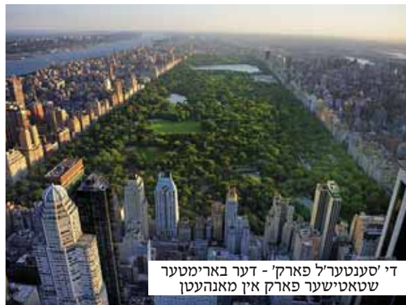
די 'סענטערל פארק' - דער בארימטער שטאטישער פארק אין מאנהעטן