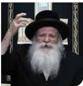
הגה"צ רבי אהרן טויסיג שליט"א משפיע רוחני

פון די ווערטער פון רבנים און צדיקים אויף ענטפערן אמן