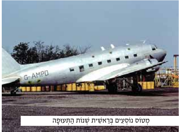
מטוס נוסעים בראשית שנות התעופה