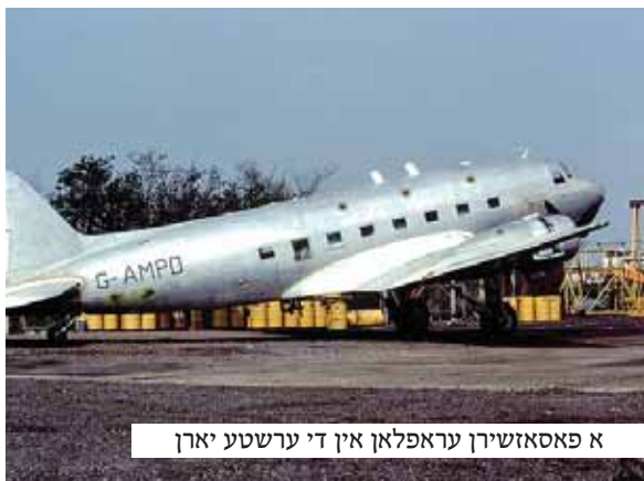
א פאסאזשירן עראפלאן אין די ערשטע יארן

רבי יעקב יוסף האט זייער מקפיד געווען מיט'ן גאנצן הארץ צו דאווענען מיט מנין, און דאס איז נישט געווען קיין קלייניקייט, ווייל א היפשע טייל פון זיין לעבן האט ער געהאנדלט מיט 'פעל', און צוליב זיין ביזנעס האט ער געמוזט ארומפארן גרויסע שטרעקעס מיט באהנען און שיפן, וואס דאס האט געמיינט צו דאווענען אסאך תפילות ביחידות. פון